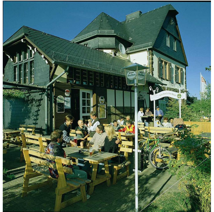
Alter Bahnhof in Pfalzfeld