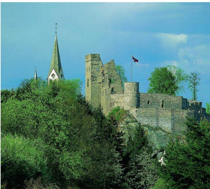
Blick auf Burgruine Kastellaun