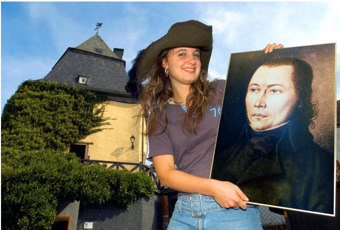
Schinderhannesturm in Simmern Autor Iris Müller Quelle Hunsrück-Touristik GmbH