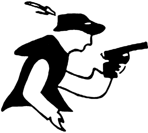
Logo Schinderhannes-Radweg Autor Iris Müller